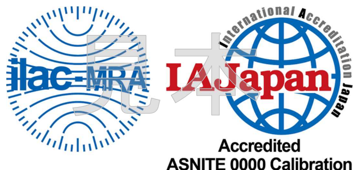
図1 認定事業者が使用できる認定シンボル

認定事業者は、認定された範囲について、図1のILAC MRA組み合わせ認定シンボルの使用及び認定要求事項に適合している旨の記載ができる。認定シンボルを使用する場合は、別に定める「IAJapan認定シンボルの使用及び認定の主張等に関する方針(URP15)」に掲げる事項を遵守すること。